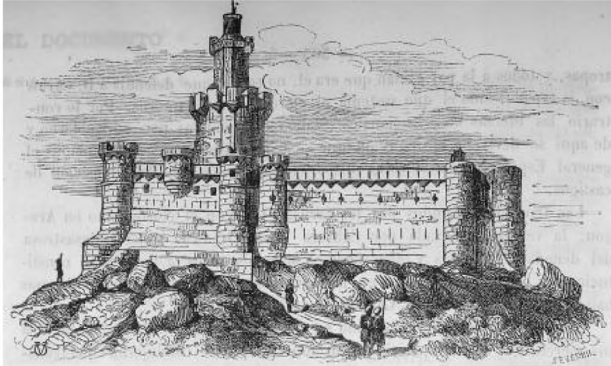
Castello dei Guebara, Spagna